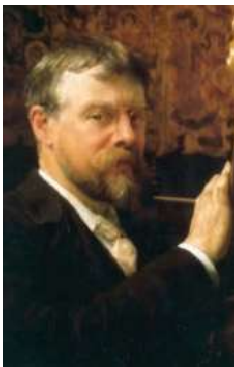
Lourens Alma Tadema, zelfportret

De prachtige tentoonstelling van Alma Tadema – klassieke verleiding in het Fries Museum in Leeuwarden. Een Fries die via Italië in Londen wereldberoemd wordt met zijn op Rome geïnspireerde schilderijen. Ik kan u aanraden de dag van tevoren alvast naar Leeuwarden te gaan. Dan kunt u de volgende ochtend al om tien uur bij de ingang staan. En wanneer u een museumkaart hebt dan kunt u via internet een toegangskaartje (toeslag) kopen, scheelt enorm bij het naar binnen gaan. Meer info op friesmuseum.nl .